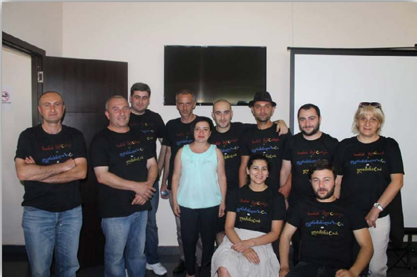
კავშირი „ნაბიჯი მომავლისკენ“ წარმომადგენლები

სტატუსის შესახებ. ეროვნული კამპანიის ფარგლებში საქართველოს 8 ქალაქში ღონისძიებები გაიმართა. ადგილობრივ დონეზე ღონისძიებებს ორგანიზება გაუწია ნარკოტიკების მომხმარებელთა საქართველოს ქსელის (GeNPUD), პაციენტთა თემის საკონსულტაციო საბჭოს (GeCAB) წევრმა თვითორგანიზაციებმა,